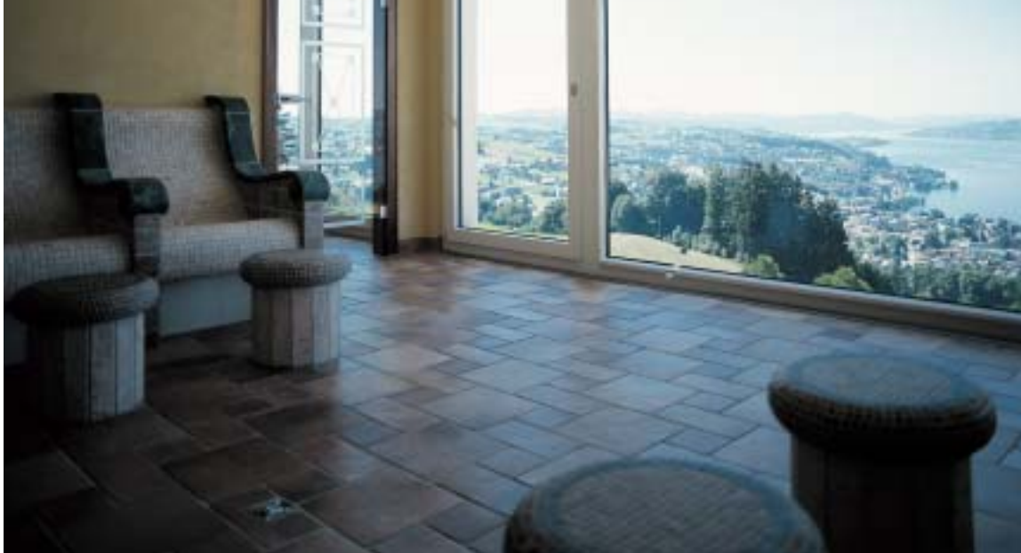
Im Beauty-Bereich locken verschiedene Massagen, Schönheitsbäder und Therapien: Perlenbad, Thalassobad, Japanisches Luxusbad mit Erholungsraum im Hintergrund (obere Reihe). Auch vom Tepidarium aus ist der Blick frei auf die Landschaft (unten).

Saunakabinen, die zum Schwitzen, Inhalieren und Dampfen einladen und die Gesundheit und das Wohlbefinden fördern. Die Schwitzstube ist traditionell mit Holz ausgekleidet, die romantische Sole-Inhalationsgrotte und die Edelsteingrotte erinnern an Bäder aus 1001 Nacht. Im Römischen Trocken-Schwitzbad kann sich der Körper entschlacken und entgiften, im Kräuterdampfbad riecht es verlockend nach Heublumen und Lavendel, während im Caldarium der Dampf eine wohlige Wirkung auf Psyche und Nerven ausübt. Natürlich fehlen im Panorama auch der Kneippbach und das Fussesprudelbecken nicht. Zum Abkühlen nach dem Schwitzen stehen aus hygienischen Gründen keine Kaltwasserbecken zur Verfügung, sondern Eiskristalle: Ein Löwe speit Flockeneis-Stücke, mit denen der Gast seinen Körper einreiben und abkühlen kann.