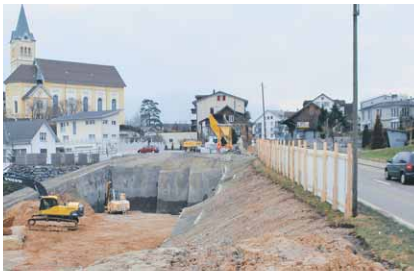
Es läuft was in Reichenburg: Auf der Wiese bei der Süsswinkelstrasse reiht sich Baugespann an Baugespann, hier sollen über 60 Wohnungen entstehen (links). Daneben der grosse Aushub an der Kantonsstrasse.

den neuen Wohneinheiten winken, natürlich willkommen. Doch eine grosse Zuwanderung läuft Hand in Hand mit weiteren Verpflichtungen. Diese seien laut Oetiker auch wahrgenommen worden. «Wir haben vieles unternommen, um künftig noch mehr Einwohner aufnehmen zu können. Zum Beispiel wurden Strassen saniert, verschiedene Erschliessungen realisiert oder eine zweite Turnhalle gebaut. Ebenfalls könnten wir eine grössere Anzahl an Schulkindern aufnehmen», zählt der Gemeindepräsident ver-