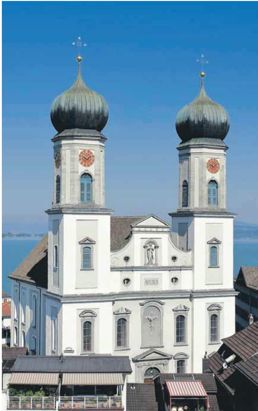
Die Lachner Katholiken feiern am Sonntag den Namenstag der 300-jährigen Pfarrkirche.