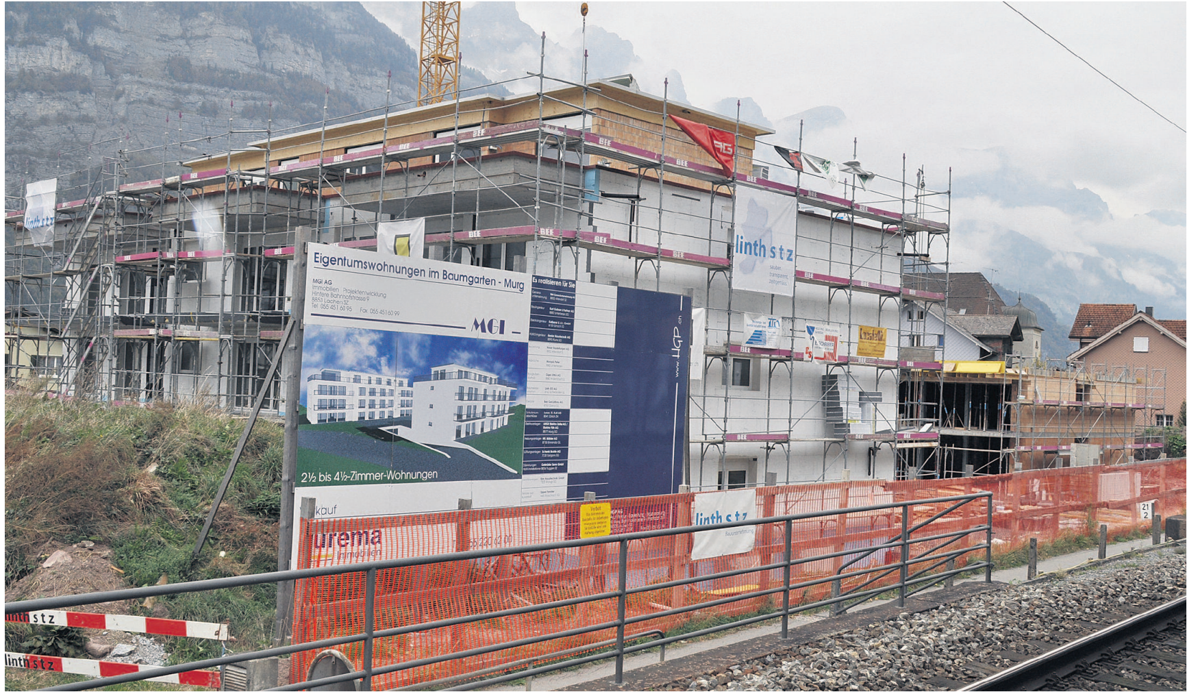
Die Bauherrschaft schaut nun selbst zum Rechten: Trotz GU-Konkurses wird die Murger Überbauung «Im Baumgarten» wie geplant fertig erstellt.